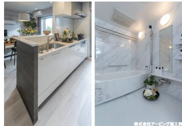
株式会社アービング施工例