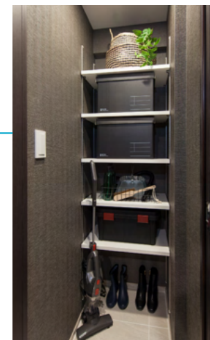
シューズインクローゼット ※タイプにより異なります。