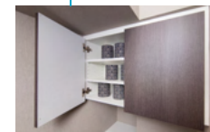
サニタリーキャビネット