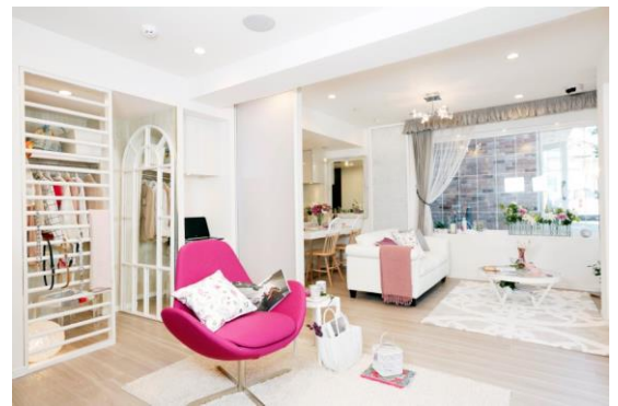
自由が丘「サクラティアラマンションサロン」

女性のための快適住まいづくり研究会では、研究会設立以降 25 年間に渡って蓄積された 8 万人以上の会員の声を形に、シングル女性のマンション購入を応援して参りました。女性が快適に暮らすためのお部屋には立地・間取り・価格だけでなく、収納、そして設備仕様、セキュリティ・管理体制などすべてに様々な工夫があります。また、今後はこれらの企画だけでなく、暮らし始めてからの毎日を楽しく充実した生活を送るための自分にあったお部屋のインテリアコーディネートが非常に重要な要素と考え、大塚家具とのコラボレーションの実現に至りました。