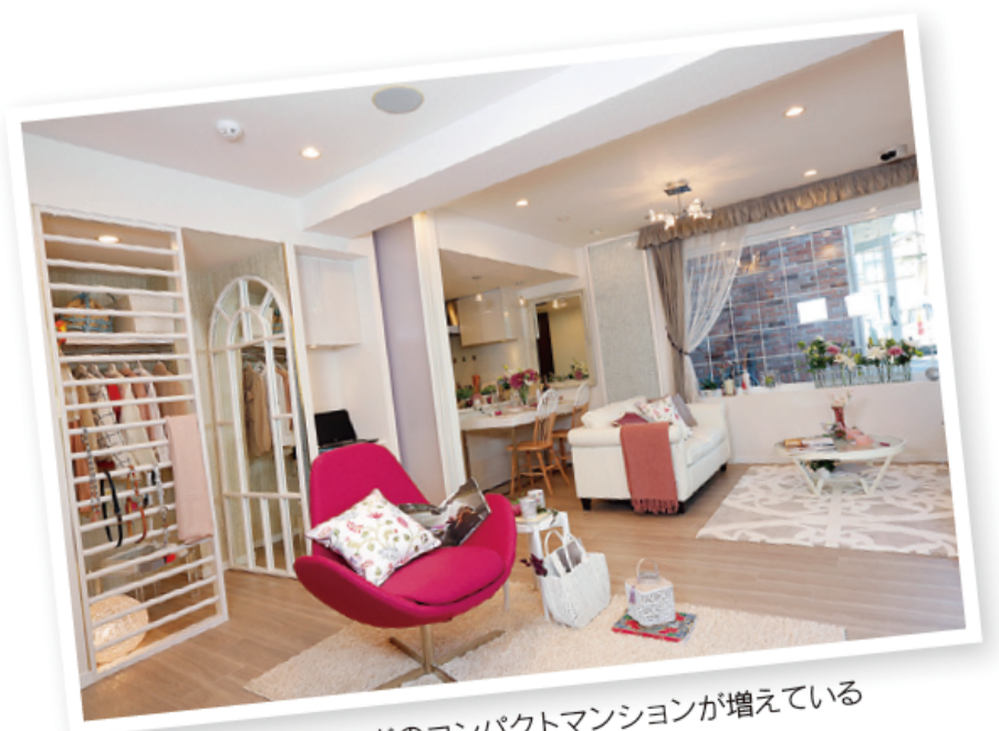
30㎡～50㎡の1LDKなどのコンパクトマンションが増えている